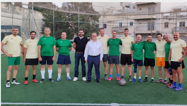
LOGHBA FRIENDLY B'RISQ L-ALS