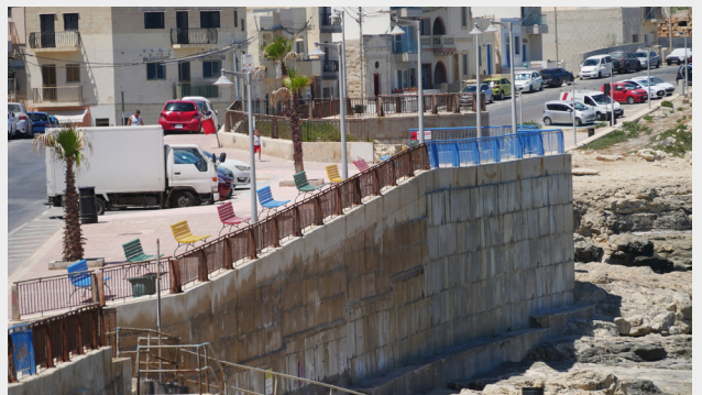
IR-RAILINGS MAX-XATT TAX-XGĦAJRA