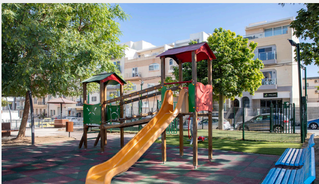
ĠNIEN MADONNA TAL-ANĠLI, BAHAR IĊ-ĊAGĦAQ