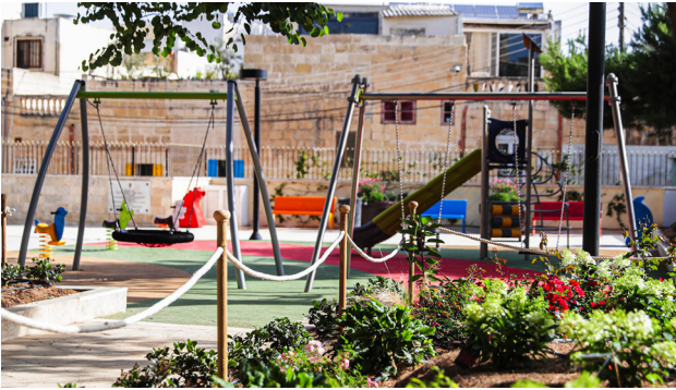
ĠNIEN BIR L-ILJUN, IR-RABAT