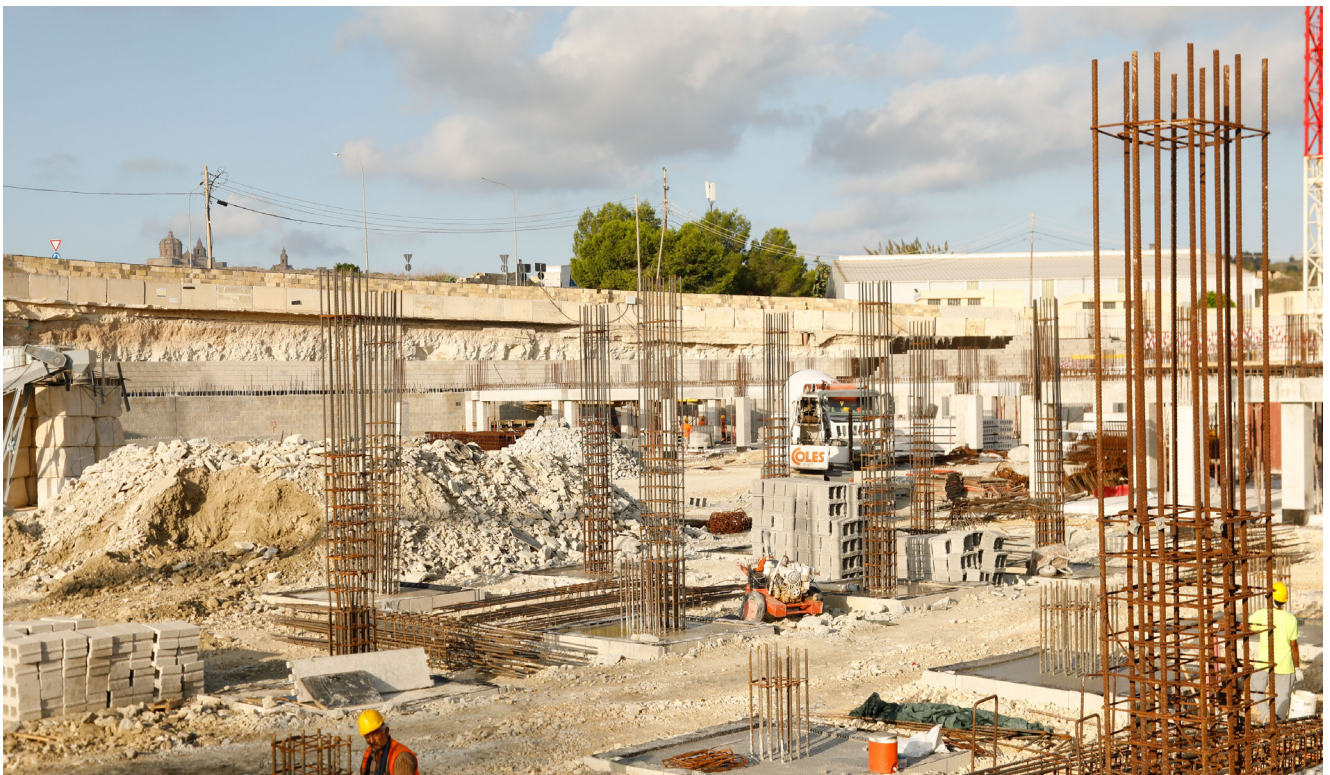
XOGHOL LI BHALISSA JINSAB GHADDEJ FUQ IL-CAR PARK TAL-PARK NAZZJONALI TA' MALTA F'TA' QALI

Riċentament qegħdin ukoll naraw li nimplimentaw proġetti li jkunu aktar sostenibbli mill-aspett ambjentali, dan permezz ta' għażla ta' materjali u teknoloġiji moderni fost l-oħrajn. Huwa permezz ta' dawn il-miżuri li d-Dipartiment ikompli jsahhaħ l-operat tiegħu lejn tiewtiq ta' proġetti tal-oghla kwalità, senġha u hila.