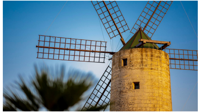
L-ANTENNI TAL-MITHNA TAX-XAROLLA