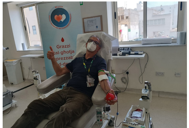
GRUPP TA' HADDIEMA JAGHTU D-DEMM FIL-JUM DINJI TAD-DONATURI TAD-DEMM