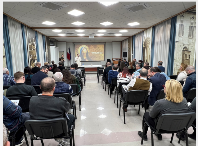
ORGANIZZATI L-EŻERĊIZZJI TAR-RANDAN U MQADDSA L-QUDDIESA TAD-DULURI