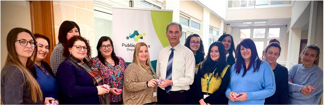
TIFKIRA LIN-NISA KOLLHA FIL-JUM INTERNAZZJONALI TAL-MARA