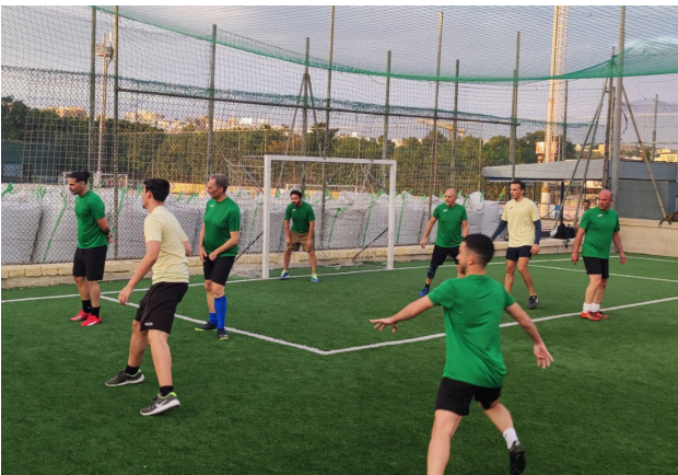
LOGHBA FUTBOL FRIENDLY B'RISQ L-NGO STEP UP FOR PARKINSON'S